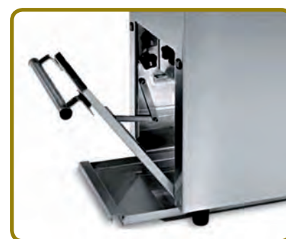
DET. BANDEJA EXTRAÍBLE RECOGE GOTAS