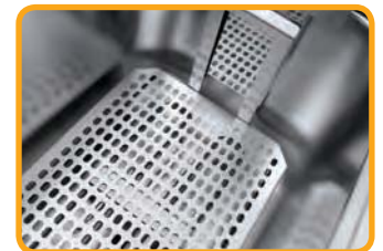
DETALLE FONDO CUBA