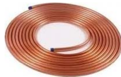
Rollos 15 mts