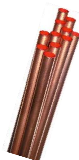
Suministro en barras de 4 o 5 metros