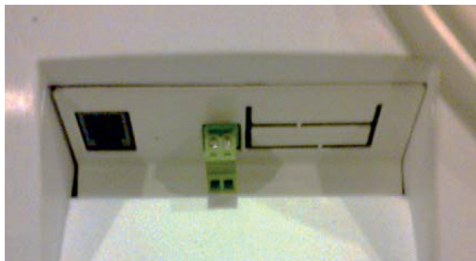
Central DF SKY