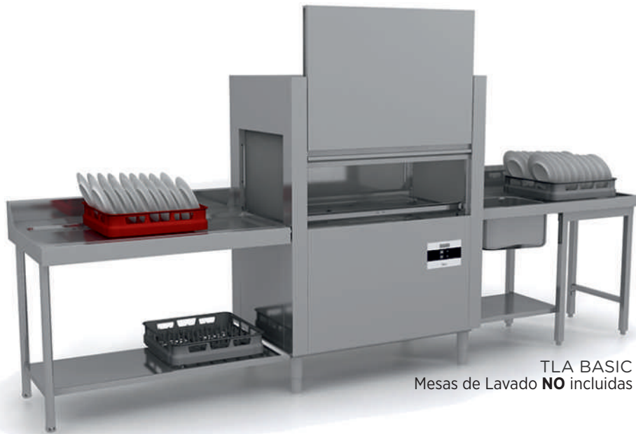
TLA BASIC Mesas de Lavado NO incluidas