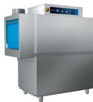
LA-120-I + AS-260