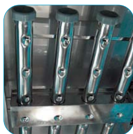
Bombas de lavado independientes para los brazos superiores e inferiores.