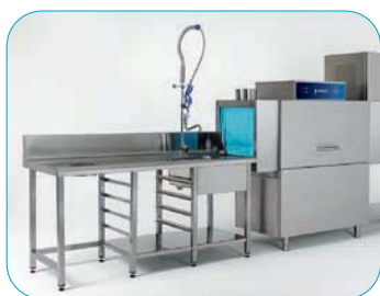
Modelo con entrada de cestas por la izquierda (-I)