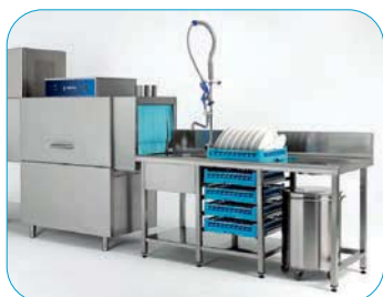
Modelo con entrada de cestas por la derecha (-D)