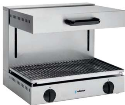
SE-E-60-M Salamandra de gran capacidad con alta potencia de cocción