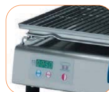
Panel de mandos con visualización digital.