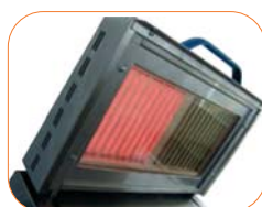
Calentamiento inmediato con zonas de cocción independientes.