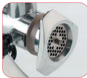
Detalle de la boca.