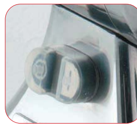
Interruptor marcha-paro con relé.