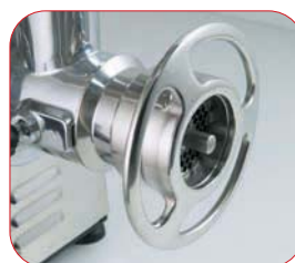
Detalle de la boca de la PI-22-U con sistema 1/2 Unger.