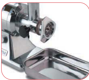
Con bandeja de recogida en acero inoxidable incorporada.