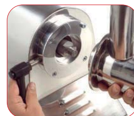
Modelo PI-32 con boca fácilmente desmontable para su limpieza.