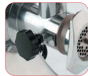
Completamente desmontable para una fácil limpieza.