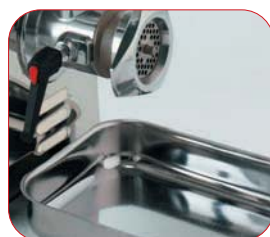
Bandeja de recogida en acero inox.