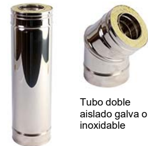
Tubo doble aislado galva o inoxidable